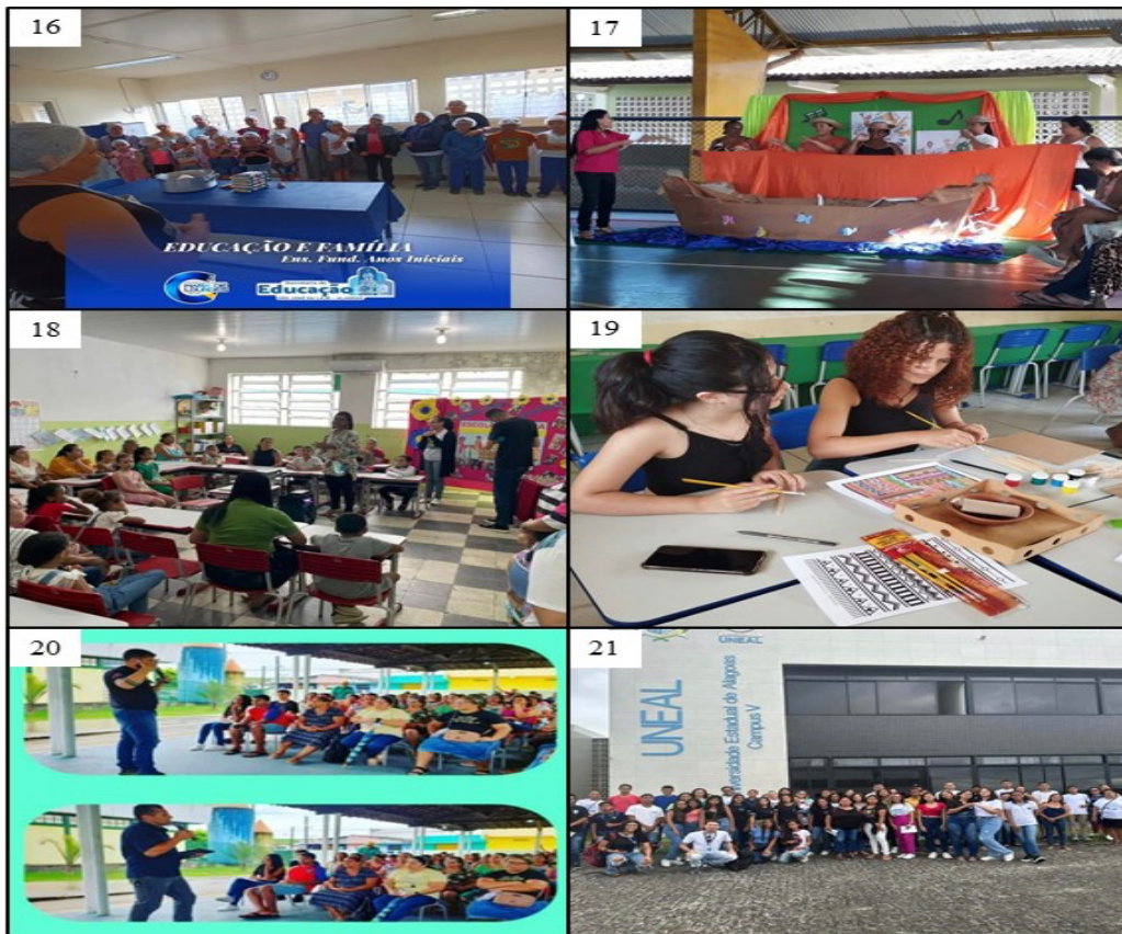
Foto 16 - Oficina “Conhecendo o cardápio da escola” – Centro Educacional (Armando Lyra).