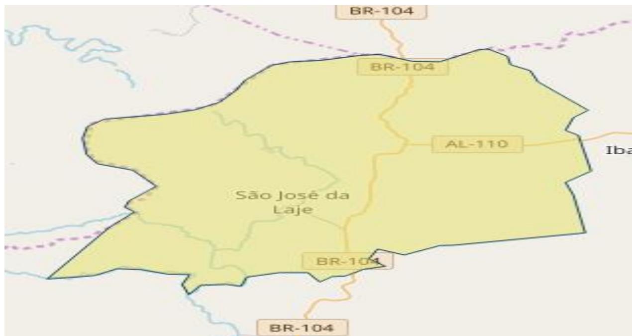
Figura 1 – Mapa do município de São José da Laje – AL – 2020.

O município de São José da Laje está localizado na zona da mata do Estado de Alagoas e tem uma área de extensão de 2256.603 Km 2 Km 2 , altitude 245 m acima do nível do mar, acesso a BR 104, distanciando da capital do Estado a 100Km. As unidades de saúde estão distribuídas em seu território urbano e rural .