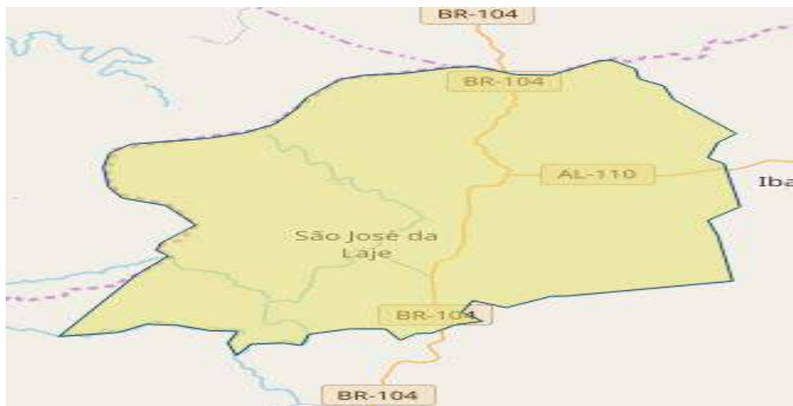
Figura 1 – Mapa do município de São José da Laje – AL – 2018.

No município de São José da Laje observa-se que cresce a cada ano tendência de migração da população da área rural para área urbana devido ao êxodo rural e falta de oportunidade de trabalho na área agrícola. Concentrando-se o sistema produtivo latifundiário.