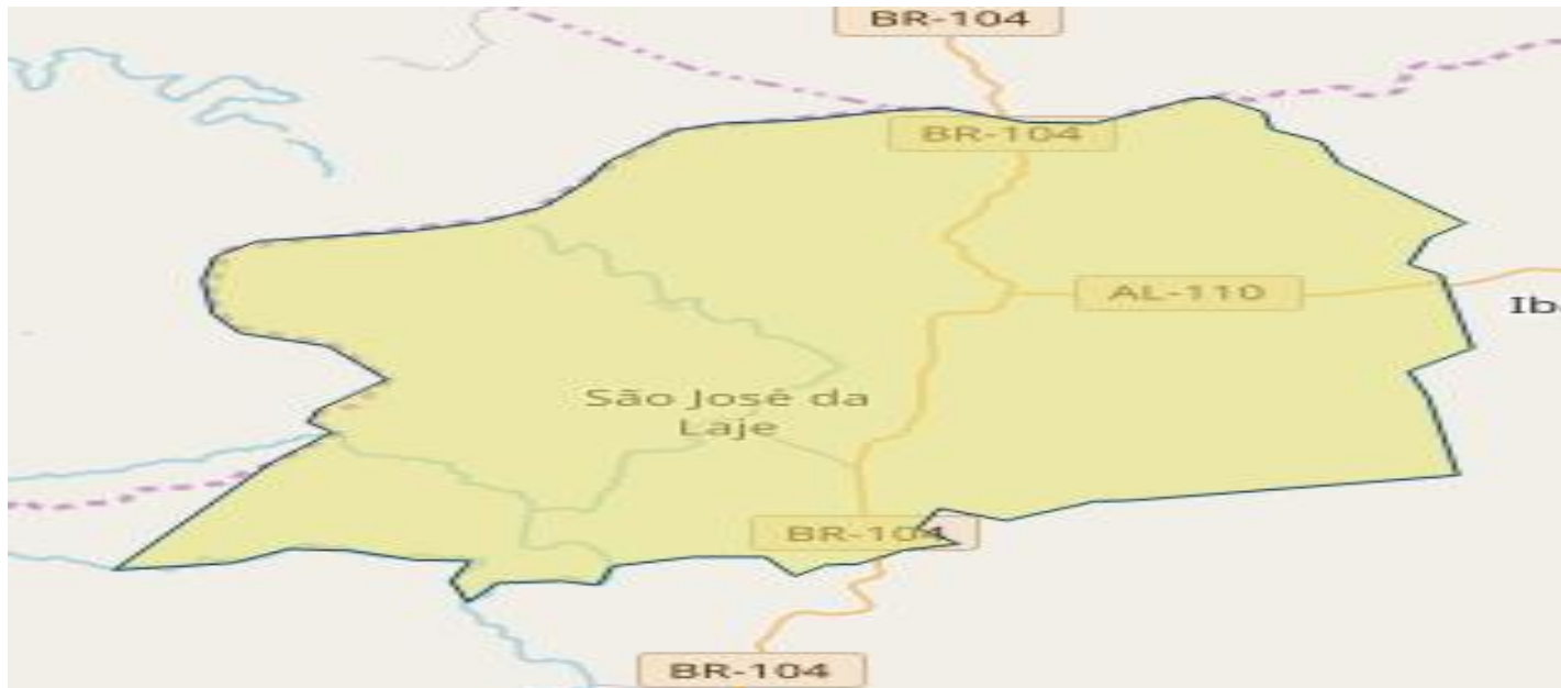
Figura 1 – Mapa do município de São José da Laje – AL – 2018.

O município de São José da Laje está localizado na zona da mata do Estado de Alagoas e tem uma área de extensão de 299 Km 2 , altitude 245 m acima do nível do mar, acesso a BR 104, distanciando da capital do Estado a 100Km. As unidades de saúde estão distribuídas em seu território urbano e rural .