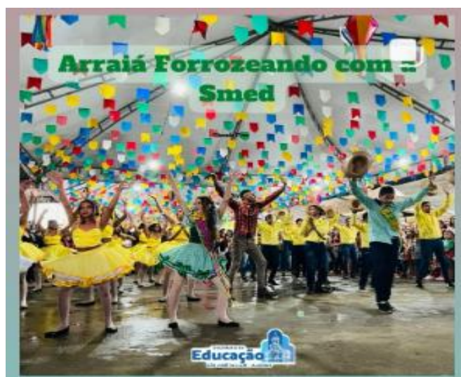
Figura 9: Apresentações Junina

Outro ação de muito significado para nossa comunidade escola foram as apresentações juninas realizadas na Avenida Arlinda Veras contando com a participação das escolas e para apreciação de toda a sociedade lajense