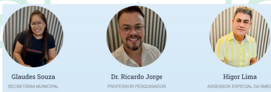
Figura 1: Equipe da DDGE https://educaacaolaje.al.gov.br/ddge

Equipe da Secretaria Municipal de Educação :