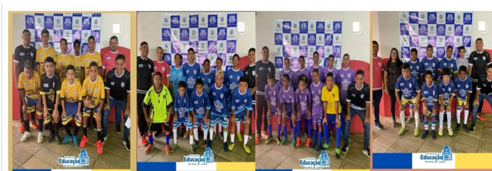
Figura 8: Jogos Internos e Jogos Estudantis Alagoano

Nesse ano, nossos alunos do Ensino Fundamental Anos Finais participaram dos jogos estudantis internos do município e também dos Jogos Estudantis Alagoano na cidade de União dos Palmares.