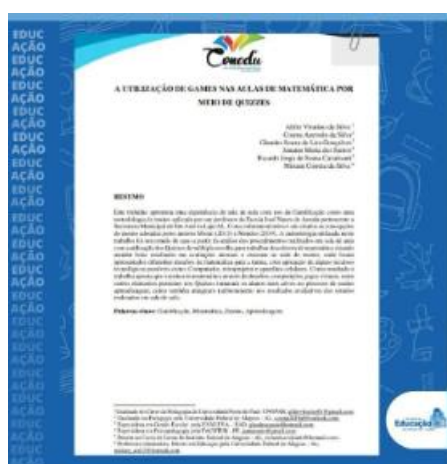
Figura 7: Apresentação de pesquisa