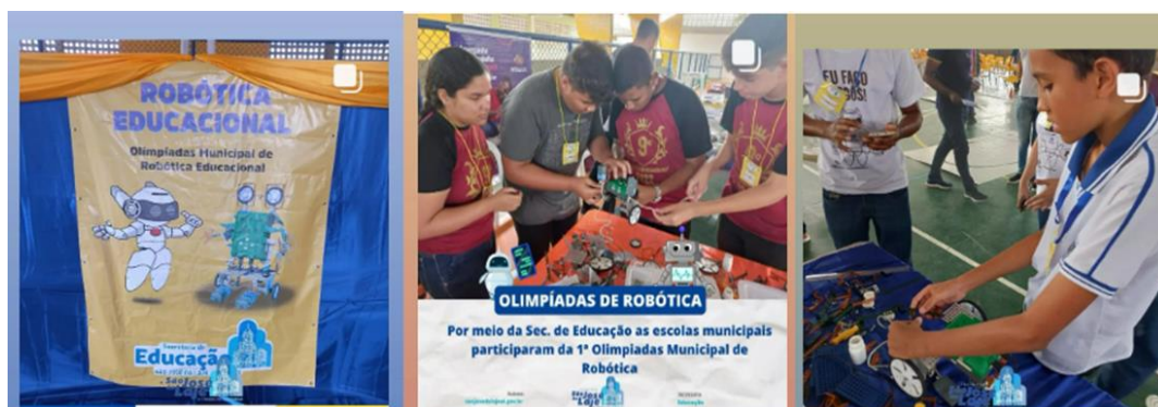
Figura 10:Gincana de Robótica

A abordagem da Robótica Educacional deve ser complementada com a aplicabilidade dos robôs construídos nas propostas curriculares das escolas. Dessa forma, o uso de robôs pode ajudar a ilustrar problemas que exigem raciocínio lógico, matemático ou geométrico nos mais diversos componentes curriculares .