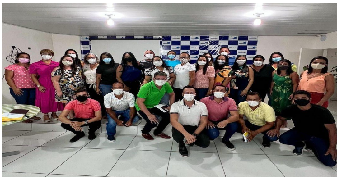
Figura 3: Auditório Municipal de Educação-SMEDa

As formações continuadas em serviço permanecem sendo o carro chefe da Secretaria de Educação, realizadas, em sua maioria, pela equipe da DDGE que a partir do diagnóstico das turmas de cada escola pactua com elas as metas que cada uma precisa alcançar, quer estabelecidas pelo MEC, quer estabelecidas por meio do regime de colaboração com o governo do Estado por meio da adesão do Programa Escola 10.