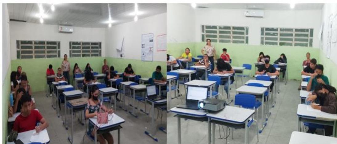
Figura 12: sala de Matemática - OBMEP

E esse ano nosso município organizou um espaço pedagógico na Escola Benício Barbosa onde os alunos que iriam participar da prova da OBMEP tiveram aulas no contraturno com a Professora Izabel Estevam .