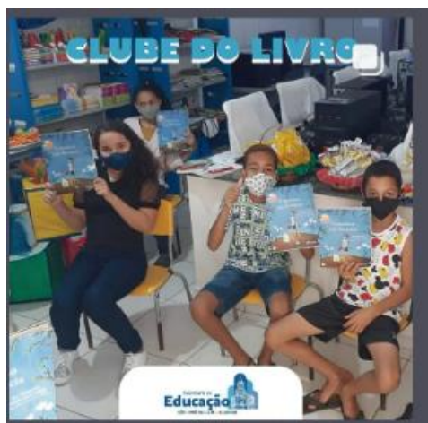
Figura 6: Projeto de Leitura