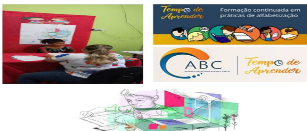
Figura 5: avaliação de Fluência e o Programa Tempo de Aprender

O Sistema Scliar e o Programa Tempo de Aprender dialogam entre si, pois bebem da mesma fonte científica. A DDGE realiza formações continuadas com os profissionais da alfabetização dando suporte pedagógicos para o alinhamento das ações dos dois programas. O Tempo de Aprender utiliza a plataforma AVAMEC, indicada para cursos de aperfeiçoamento dos docentes e gestores das instituições de ensino.