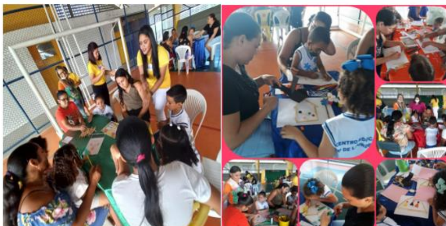
Figura 11: ação do Programa Educação e Família.

Outra ação desenvolvida corresponde ao Programa Educação e Família-PEF, cujo objetivo é fomentar e qualificar a participação da família na vida escolar do(a) em como na construção do seu projeto de vida. A adesão ao programa aconteceu em 30 de agosto de 2021. A partir desta data, com reuniões de monitoramento e acompanhamento iniciaram-se os trabalhos de elaboração do plano de ação e posteriormente, execução das ações.