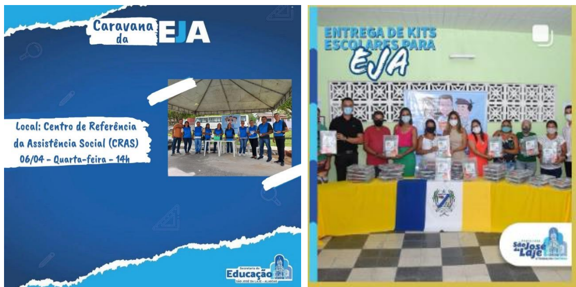
Figura 4: Caravana da EJA nas intermediações das Avenidas Siqueira Campo e entrega dos kits escolares para EJA

Uma outra atuação da SMED tem sido o investimento numa etapa específica do Ensino Básico a saber: os primeiros anos do Ensino Fundamental anos iniciais, nos 1º e 2º anos. Esse período é considerado pela BNCC o recorte temporal para que as crianças sejam plenamente alfabetizadas, fato que alterou a meta 5 do Plano Nacional de Educação –PNE e consequentemente o Plano Municipal de Educação- PME.