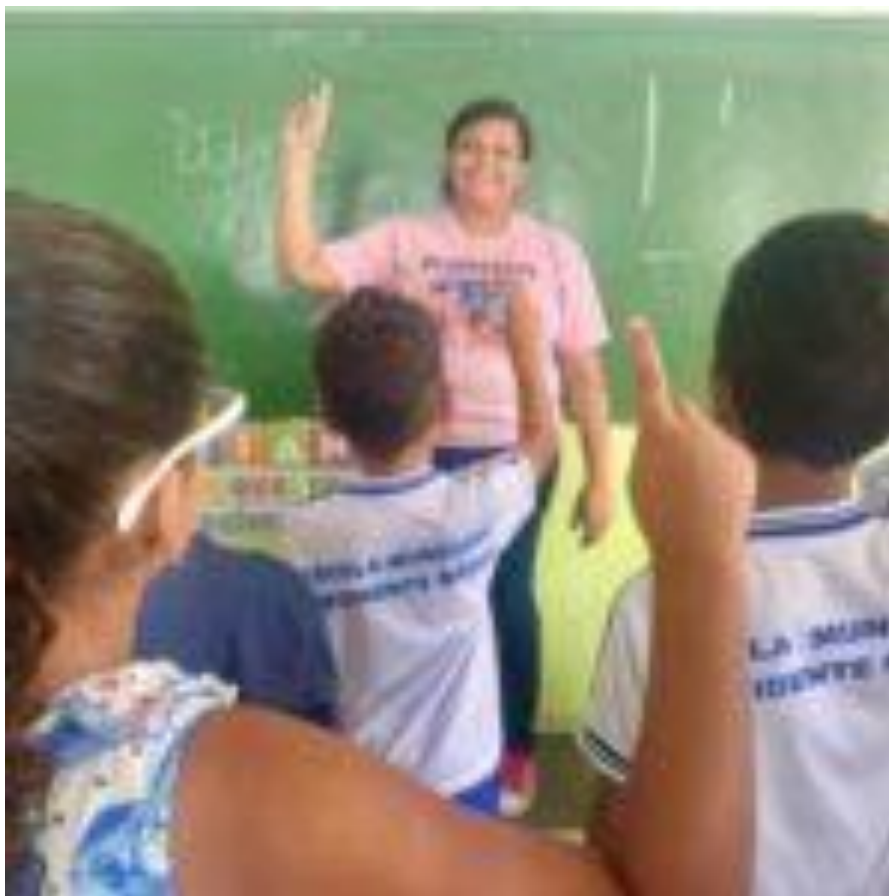
Prefeita Angela Vanessa antecipa pagamento da segunda parcela do 13º salário dos servidores da educação

São José da Laje: Prefeita Angela Vanessa antecipa pagamento da segunda parcela do 13º salário dos servidores da educação Além de já ter antecipado a primeira parcela do 13º salário, a Prefeitura de São José da Laje agora paga com antecedência também nesta quarta-feira (9), a segunda parcela aos servidores efetivos da Secretaria Municipal de Educação. O pagamento foi anunciado pela prefeita Angela Vanessa. “Já realizamos o pagamento antecipado da primeira parcela do 13º de todos os servidores efetivos do município, estamos agora antecipando a segunda parcela dos servidores da educação e dentro do calendário nas próximas semanas também iremos antecipar a segunda parcela dos demais servidores efetivos, isso é fruto de uma gestão comprometida com a valorização do servidor público.” Destacou a prefeita Angela Vanessa. Além de valorizar os servidores, que têm a segurança e a chance de planejar suas finanças, a antecipação do benefício permite uma movimentação financeira estratégica para a economia da Cidade, com a injeção no comércio local. O município de São José da Laje tem se destacado ao longo dos anos com os avanços alcançados através do trabalho da prefeita Angela Vanessa, a excelência na gestão financeira tem garantido o pagamento em dia dos servidores dentro do mês trabalhado e a realização de obras importantes financiadas com recursos do próprio município.