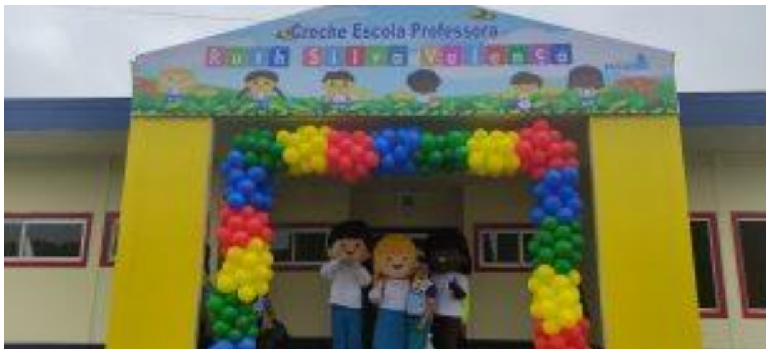
Nova Creche em São José da Laje inicia atividades e já conta com 140 crianças matriculadas

Inaugurada no dia 28 de julho, dia que o município celebrou os 136 anos de emancipação política, a creche escola Profa. Ruth Valença já iniciou suas atividades, cerca de 140 crianças de 0 a 5 anos estão matriculadas na creche que atende todas as recomendações do ministério da educação.