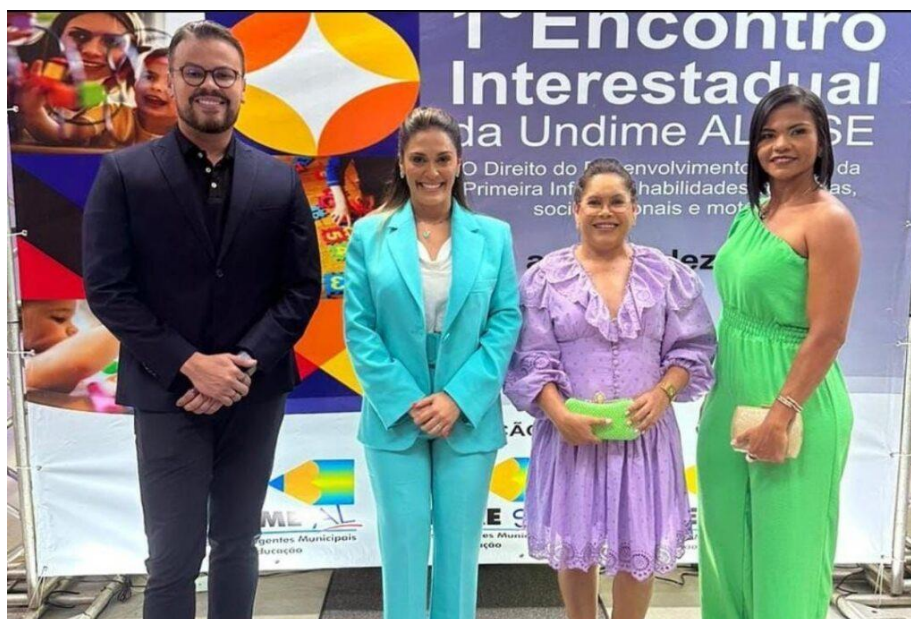
A Educação Lajense recebeu o Prêmio Municipal de Gestão da Aprendizagem - Melhor IDEB 2021

Na noite de ontem, 14/12, recebemos o Prêmio Municipal de Gestão da Aprendizagem - Melhor IDEB (2021), da União dos Dirigentes Municipais de Educação de Alagoas – UNDIME -AL, em que fomos classificados entre os 10 municípios alagoanos destaque nessa Avaliação Externa, de um total de 102 municípios que integram o território do nosso Estado.