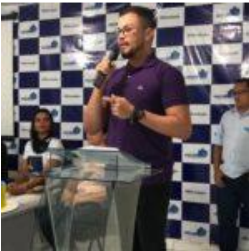
São José da Laje lança cursinho preparatório ao ENEM: “Avança ENEM Laje”

Nesta quarta dia 10, foi lançado em nível municipal o Cursinho Pré-ENEM (Exame Nacional do Ensino Médio) “Avança Enem Laje”. Numa iniciativa da Prefeitura Municipal junto com a Secretaria Municipal da Educação, jovens estudantes concluintes da 3ª série do Ensino Médio, bem como estudantes egressos e que já possuem o Ensino Médio, podem, a partir de 80 vagas ofertadas, assistirem às aulas preparatórias para submissão ao Exame, que ocorrerá em novembro próximo.