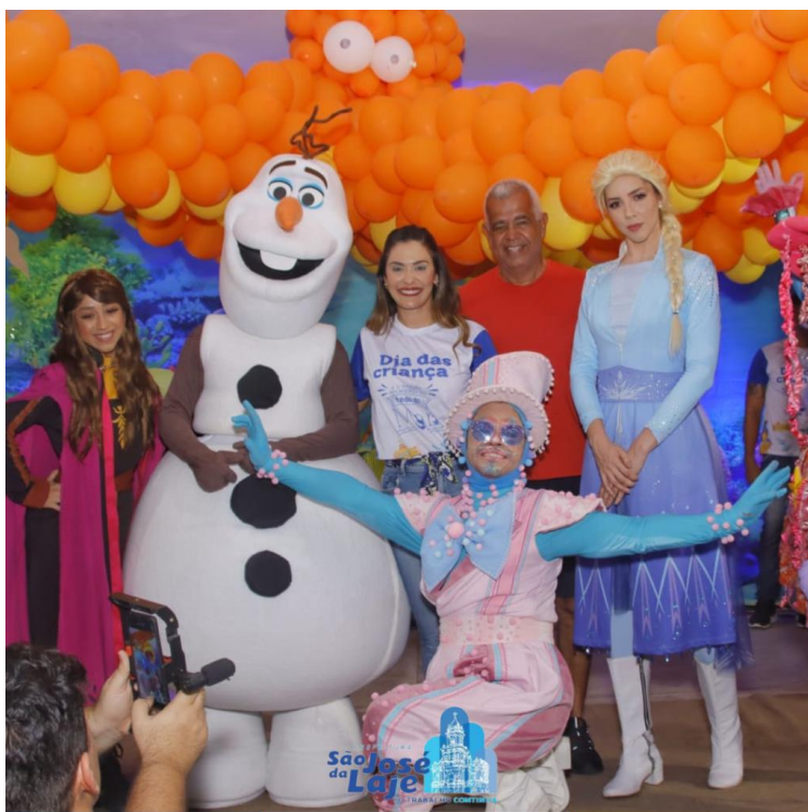
Município realiza tradicional festa do Dia das Crianças em São José da Laje

A criançada em São José da Laje fez a festa no mundo encantado do fundo do mar, proporcionado pelo poder público municipal, à festa do Dia das Crianças teve muita leitura e contos, músicas, brincadeiras, personagens infantis, muitas guloseimas, além do sorteio de dezenas de bicicletas e distribuição de brinquedos. Segundo a organização, cerca de quatro mil crianças da rede pública de ensino comemoraram o Dia das Crianças. A festa realizada pelo município, através da Secretaria de Assistência Social aconteceu neste domingo (09), no Ginásio de Esporte Militão, que foi especialmente decorado para receber a criançada.