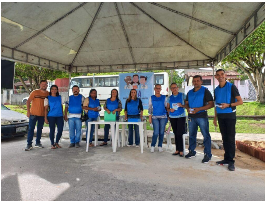
Município realiza caravana da EJA - Educação de Jovens e Adultos

A Secretaria de Educação vem sendo destaque no nosso município, e um dos motivos, é que agora ela vem inovando com a Caravana da EJA, com objetivo de ir até as pessoas para prospectar novos alunos para a Educação de Jovens e Adultos.